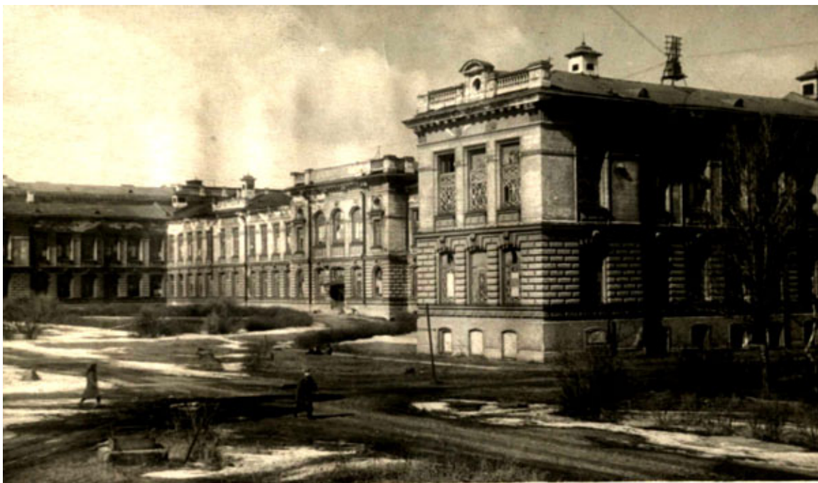
Химический корпус в 1942 году

Около 3500 политехников ушли в действующую армию и ополчение, сотни студентов и работников трудились над защитой Ленинграда и института. Война и блокада унесли жизни 545 политехников.