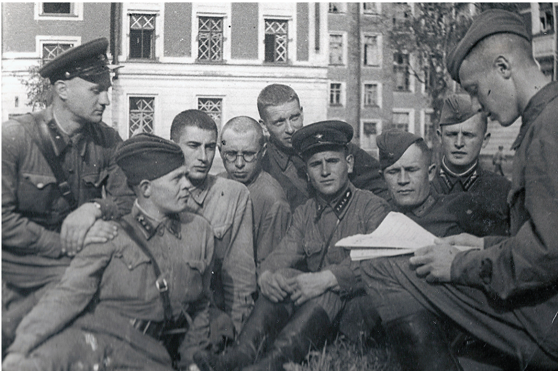
В ЛПИ действовали офицерские курсы

Война порою оставляла в учебных группах по 2-3 студента, но даже тогда учебный процесс не прекращался: стране были нужны профессионалы, конструкторы победы, инженеры будущего. Занятия переходили из аудиторий в общежития, а оттуда - в квартиры преподавателей.