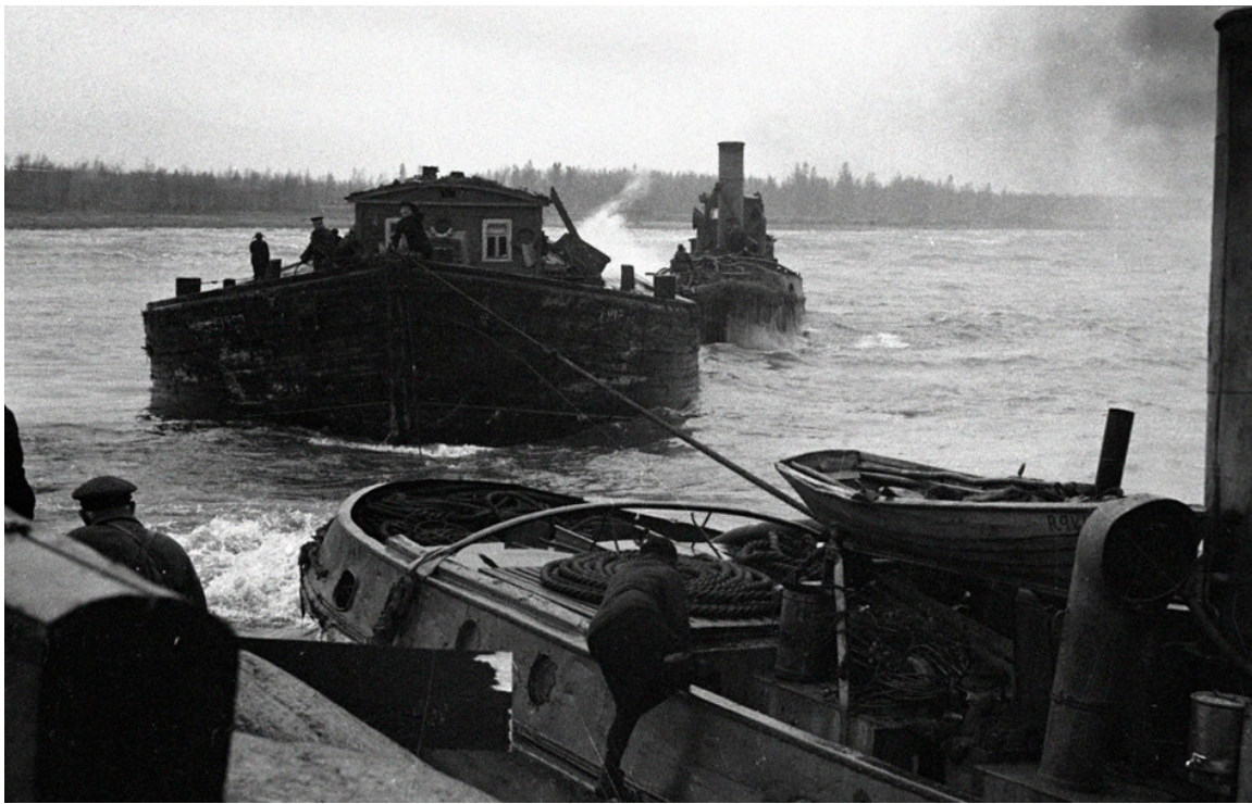
Баржа на буксире

Политехнический институт смог адаптироваться в условиях Ташкента и с 1943 по 1944 годы даже успел выпустить там 63 инженера. А после полного снятия блокады 27 января 1944 года появилась возможность вернуться в родную гавань, в Ленинград.