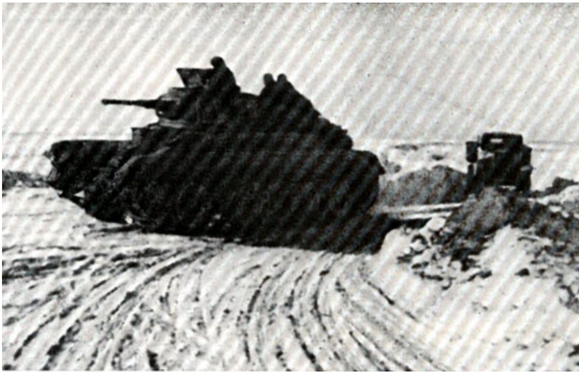
Так проверяли прочность ледяного покрова Дороги жизни