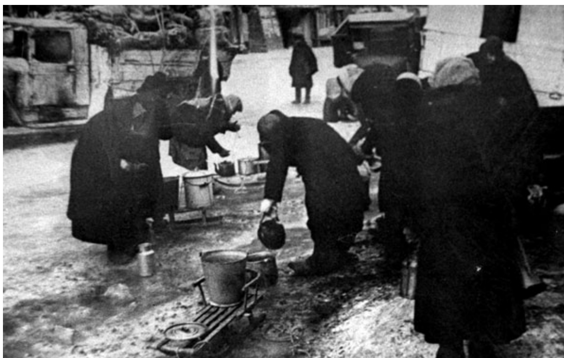
На территории института работала водозаборная колонка

Первые месяцы блокады были самыми тяжёлыми для Ленинграда и его жителей. Кажется, сама жизнь здесь замерла, оцепенела от происходящего, город замерзал, задыхался без притока самого необходимого. Но именно здесь, за минимальной порцией хлеба, возле копящихся буржеек рождалась спасительная идея Дороги жизни.