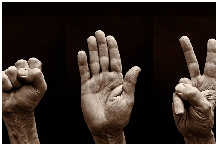
Игра "Камень, ножницы, бумага"

После Японии игра уже начала распространяться по всему миру: от США, до России.