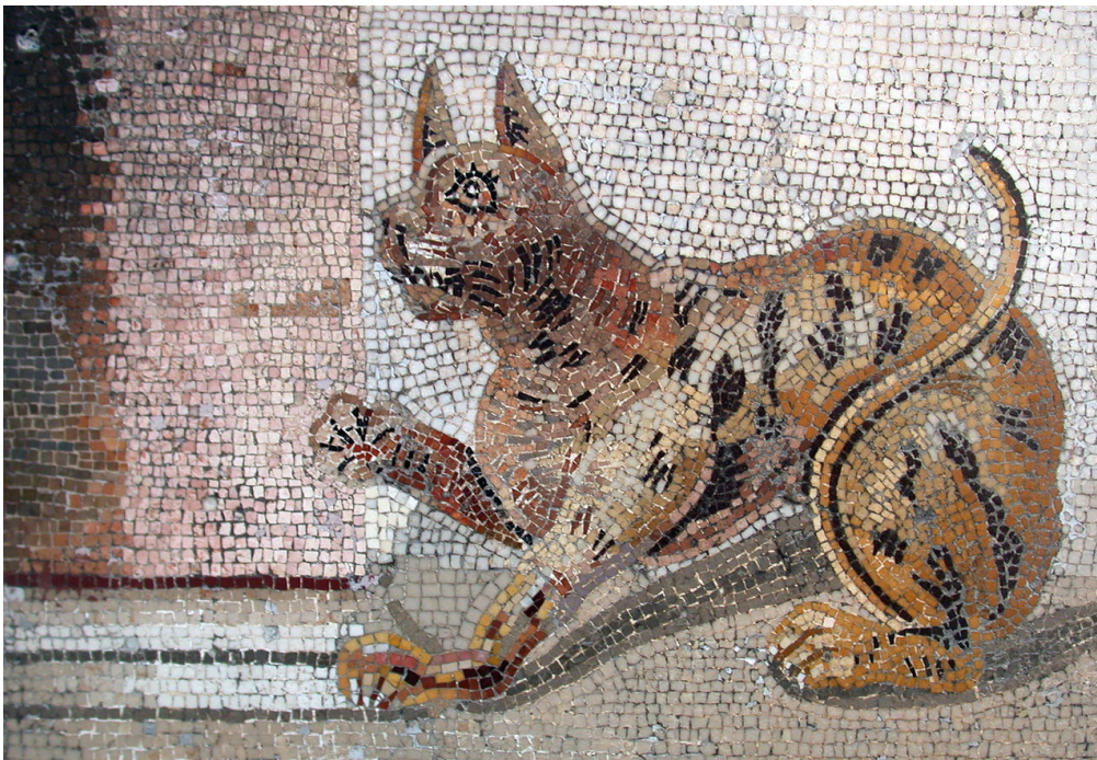
Мозаика с изображением кошки из Помпеи

У викингов кошки считались олицетворением богини красоты, магии, войны и любви, жизни и смерти Фрейи. По легенде, она передвигалась на колеснице, запряжённой двумя котами, а рукавицы на ее руках были из меха кошек. Именно поэтому викинги, к сожалению, рассматривали кошек не только как стражей амбаров с зерном, но и как источники меха. Несмотря на этот факт, стоит обратить внимание, что в период до Средних веков отношение к кошкам, в целом, было хорошим: их любили, уважали и часто даже почитали.