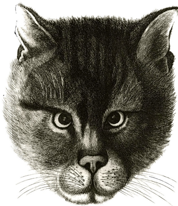
Le vrai portrait du chat du grand Duc de Moscovie . 1761.

Интересный факт: у купцов вплоть до XX века существовало развлечение: они сравнивали, чей кот крупнее и толще.